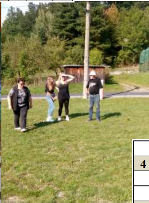
KAM AŽ TEN KOŠÓNEK LETĚL