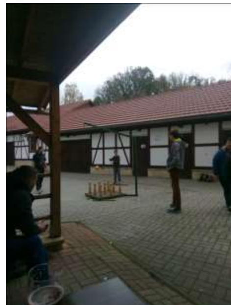
A JDEME NA TO