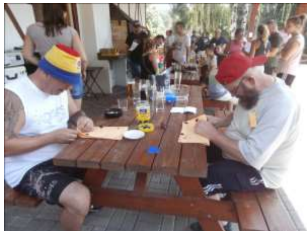
ŠJU, ŠJU SI KABÁTEK