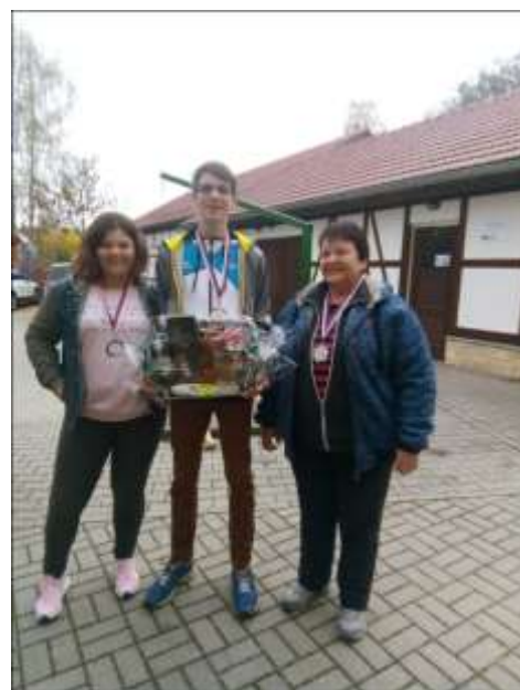
MEDAILISTÉ 11. ROČNÍKU