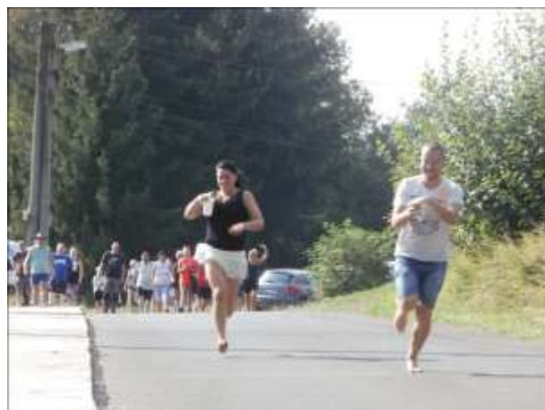
ŠTAFETA S NAPLNĚNÝMI KELÍMKY VODOU