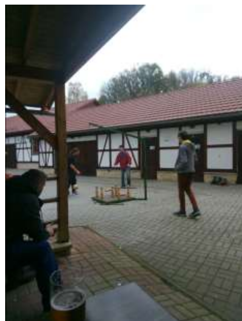
PRO ZMĚNU, STAVÍME