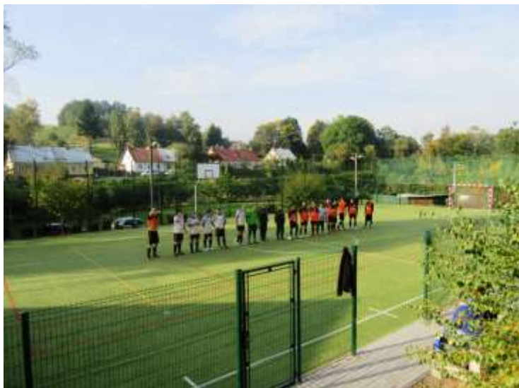
NÁSTUP MUŽSTEV PŘED ZÁPASEM RUDOLEC – RAPTORS „B“

Jak hodnotit dosavadní účinkování mužstva v soutěži? V prvních dvou zápasech jsme ztratili 3 body v poslední minutě, La Koruna vsítla vítězný gól a Lítov u nás vyrovnal. Darovali jsme St. Sedlu 3 body. Opět se ukazuje, že hráčů máme dost, ale spíše na soupisce než v samotných zápasech. Další dva stabilně hrající hráči by se určitě hodili. Jedno velké pozitivum ovšem zde je. Společně s SKP Detektiv jsme nejslušnějším mužstvem soutěže, bez jediné obdržené žluté či červené karty. Jen tak dál chlapi a nějaký ten bodík přidat do konce podzimu.