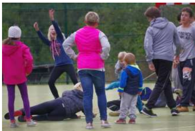
DĚTSKÁ RADOST NEZNÁ MEZÍ