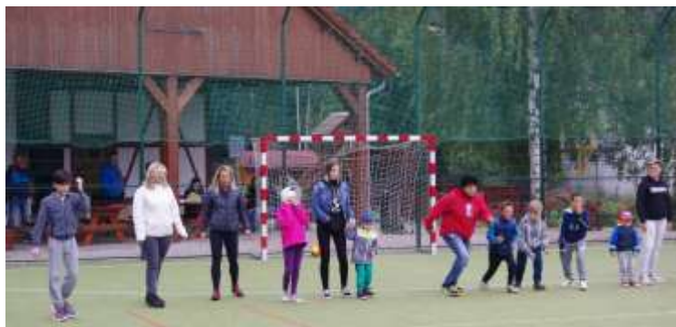
TAK A JSME PŘIPRAVENI NA DALŠÍ HRU