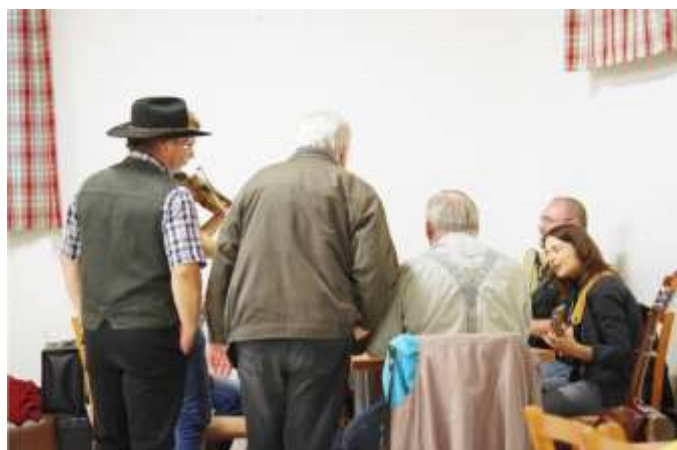
A DOMLOUVÁME DALŠÍ PÍSNIČKY – COUNTRY VEČER