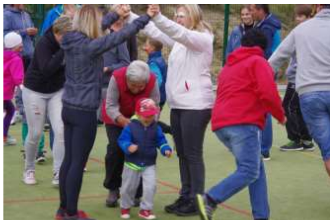
DĚTI SE BAVILY S DOSPĚLÝMI