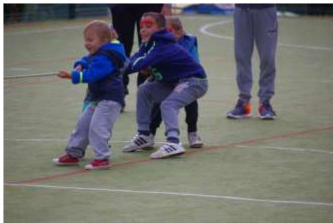
PŘETAHOVANÁ PRO MALÉ I VELKÉ