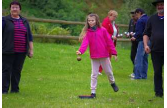
NEJMLADŠÍ HRÁČKA TURNAJE PŘI SVÉM HODU