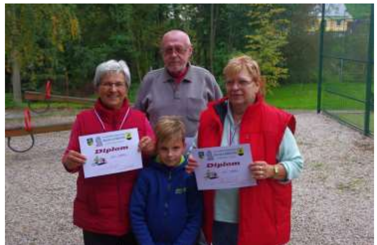
A PŘI VYHLÁŠENÍ VÝSLEDKŮ