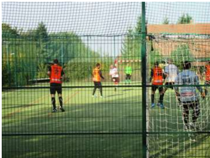
MOMENTKA Z UTKÁNÍ RUDOLEC – RAPTORS „B“