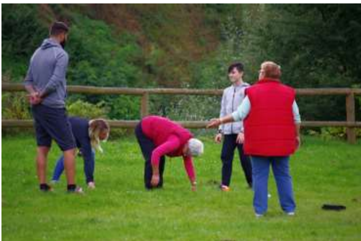
VÍTEŽNÁ DVOJICE VE HŘE