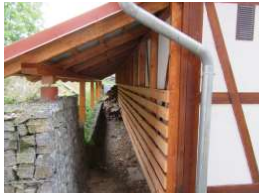
VPRAVO – PROZATÍM NE ÚPLNĚ DOKONČENÝ PŘÍSTŘEŠEK ZA VÍCEÚČELOVOU BUDOVOU

I v letošním roce se projevuje dobrovolnická činnost na tváři naší obce. Doposud letos odpracovaných 247 brigádnických hodin svědčí o tom, že se občané Rudolce neustále snaží o vylepšení vzhledu své vesničky. Z provedených akcí lze jmenovat např. generální úklid stodoly, štípání a úklidy dřeva, v rokli vybudování kamenných schodů ve stráni směrem k Zároklí, čištění rybníka, pálení kletí v rokli, oprava hráze rybníka, nátěry dřevěného plotu na louce, čištění rokle a keřů za plotem, pískování hřiště atd. Všem kteří se na těchto činnostech podílejí patří velké uznání!