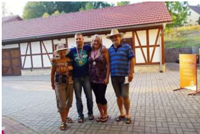
VÍTEŽOVÉ TURNAJE (uprostřed) S HLAVNÍMI ORGANIZÁTORY