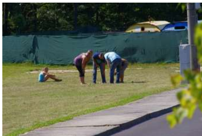
ÚPORNÉ POČÍTÁNÍ ZÍSKANÝCH KOULÍ