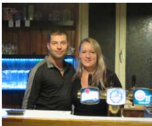
NOVÉ TVÁŘE HOSPŮDKY

Jde o dceru našeho souseda s přítelem, kteří se s vervou pustili do zkrášlení prostředí a pokouší se o zavedení novinek a zpříjemnění posezení pro své hosty. Pro hosty se sportovním zaměřením jsou připraveny profesionální šipky, stolní fotbal (v bývalém skladu) a tradičně „pool“ neboli česky děrovaný kulečník. Novou tradicí se stává sobotní grilování, kdy si můžete pochutnat na klobásce, hermelínu v alobalu nebo kukuřici. Pro milovníky piva je sortiment