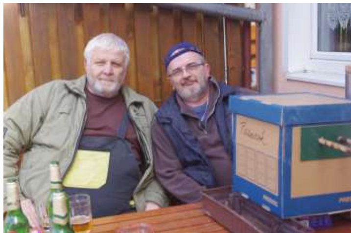
DUO PEPA A PEPA SE SVOJÍ UDÍRNOU

Pro zkoušku byla vytvořena udírna z papírové krabice, ale sestava se dá použít pro jakoukoli udírnu, jen do ní musíte vyvrtat otvor 20 mm. A jak chutnají výrobky z této udírny, se dozvíte někdy příště.