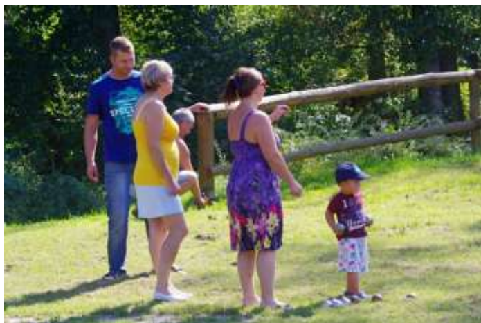
ZAPOJIL SE I MALÝ NOSIČ ČI SBĚRAČ