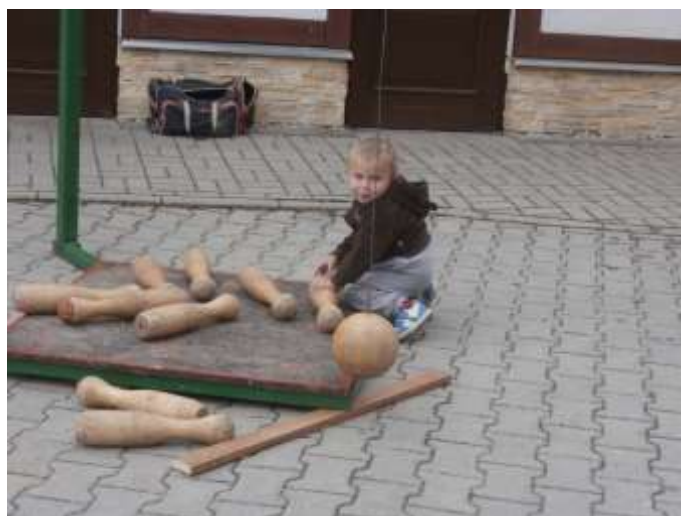
DRENKOVI NEPONECHÁVAJÍ NIC NÁHODĚ