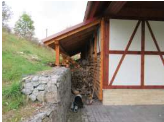
VLEVO – PLNĚ VYUŽITÝ PROSTOR PRO SKLADOVÁNÍ DŘEVA ZA RUDOLECKOU STODOLOU

Největšími akcemi bylo zbudování přístřešků za rudoleckou stodolou a víceúčelovou budovou. Za stodolou slouží přístřešek ke skladování dřeva za účelem topení v této budově při pořádání akcí v zimních měsících. Přístřešek za víceúčelovou budovou byl zbudován pro potřeby skladování dřeva pro rudoleckou hospůdku a skladování objemného materiálu, který byl do té doby umístěn v garáži budovy.