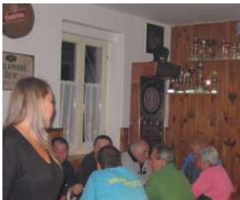
MOMENTKA Z HOSPŮDKY, V POZADÍ ŠIPKY

rozšířen o 11° velkopopovického kozla. Další chystanou změnou by měla být likvidace provizorního přístřešku na dřevo vedle naší hospůdky a přemístění uloženého dřeva pod nový přístřešek za více účelovou budovou.