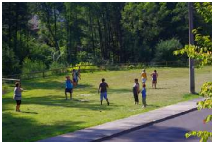
TURNAJ SE ROZBÍHÁ