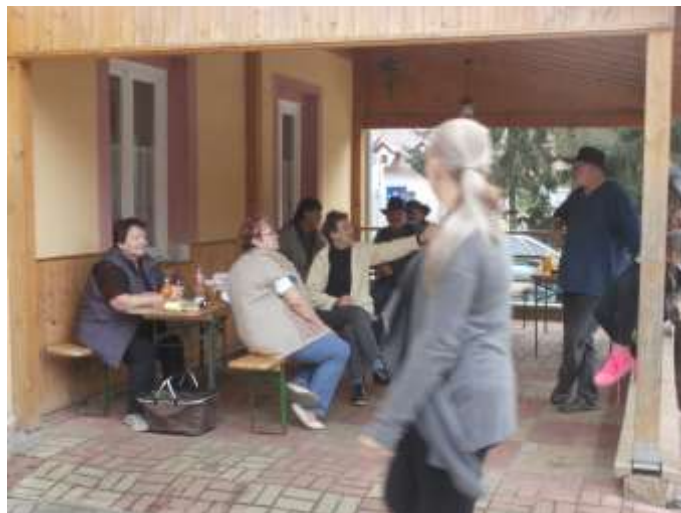
DRUŽNÁ DEBATA ÚČASTNÍKŮ MEMORIÁLU

Po tříhodinovém klání došlo k vyhlášení výsledků. Tři nejlepší hráči byli odměněni medailí s podobiznou našeho dobrého kamaráda a ostatní účastníci si pochvalovali dvě netradiční „kolečka“, došlo i na vítěze, ne jen na poraženého. Příští rok se opět můžeme těšit na další, pevně doufám, vydařený ročník.