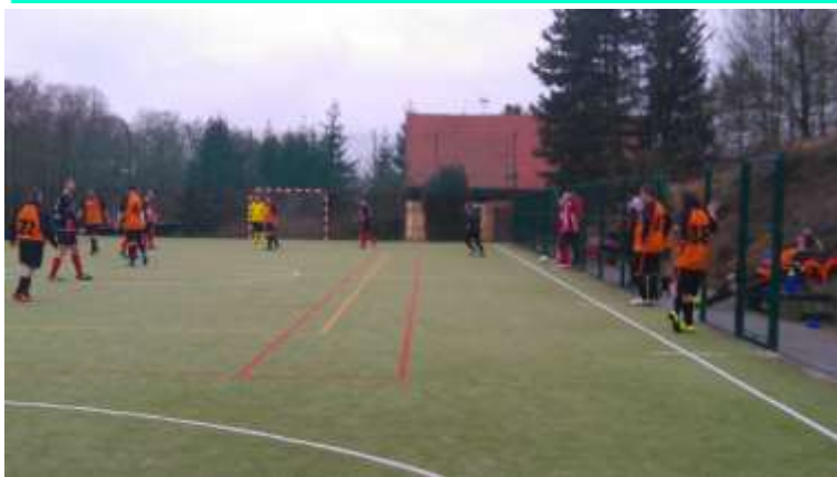
MOMENTKA Z UTKÁNÍ PROTI SEDLÁKŮM STARÉ SEDLO

V celkovém pořadí jsme obhájili loňskou sedmou příčku. Ambice však má tým na lepší umístění. Ovšem pracovní vytížení a osobní i rodinné záležitosti, které jsou příčinou vždy ne úplného kádru k jednotlivým utkáním, tyto ambice sráží na realitu. Paradoxně tím nejvíce trpí fanoušci našeho týmu hlavně v domácích zápasech. Z loňského průměru 22 diváků na zápas, klesla návštěva na průměrných 14 diváků. Určitě návštěvám diváků na domácích zápasech nepřispívá ani chování našich hráčů, po loňském desátém místě v soutěži fair-play (15 žlutých a tři červené), to letos dopadlo obdobně, desáté místo, 14 žlutých a tři červené karty. Chlapci zkuste dát hlavy dohromady a něco pro své fanoušky se pokuste vylepšit.