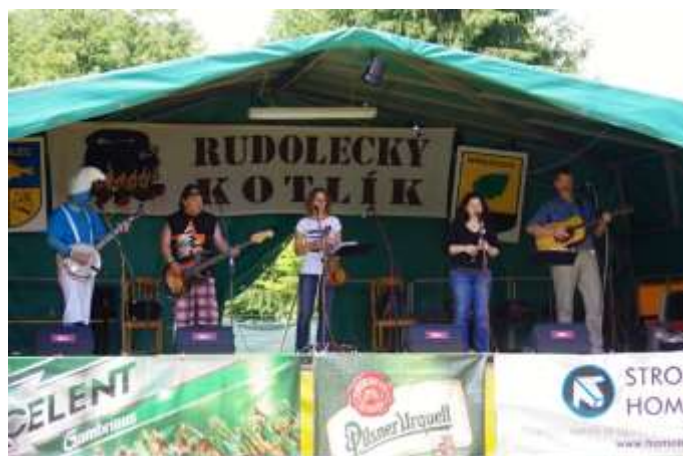
SKUPINA DRC Z OSTROVA