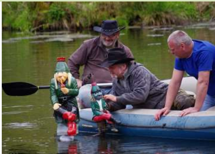
NAŠI VODNÍCI SI OPĚT LEBEDÍ