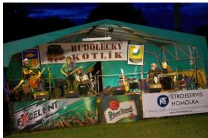
NÁDHERNĚ OSVĚTLENÉ PÓDIUM FESTIVALU