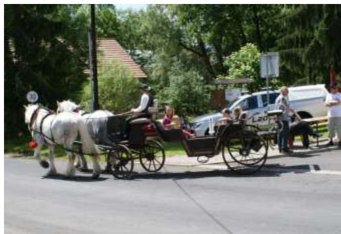
KOŇSKÝ POVOZ PŘI DĚTSKÉM DNU