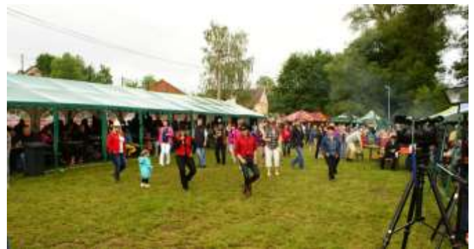
TANEČNÍ KREACE ÚČASTNÍKŮ FESTIVALU