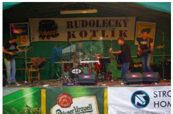
SKUPINA KAMELOT REVIVAL Z PRAHY