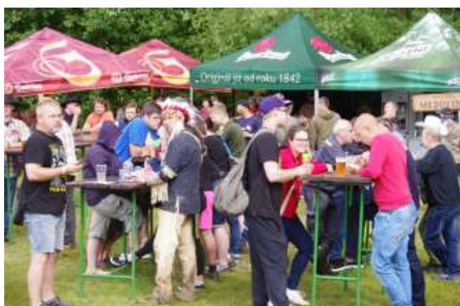
ZÁZEMÍ RUDOLECKÉHO KOTLÍKU