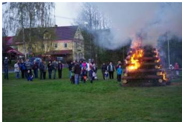
FUTSALISTÉ POSTAVILI KRÁSNOU HRANICI