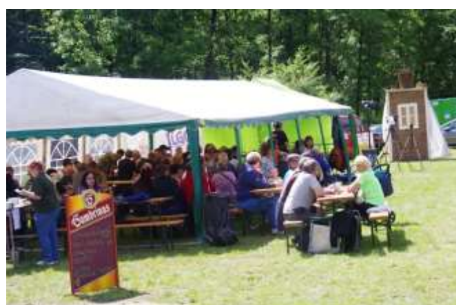
PŘÍJEMNÉ POZEZENÍ PRO DIVÁKY NA KOTLÍKU