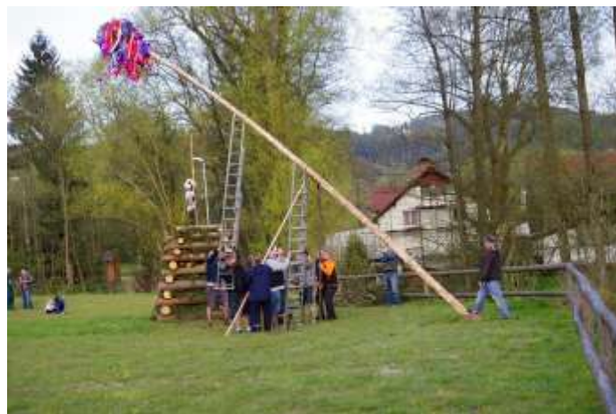
A JIŽ SE BLÍŽÍME K CÍLI