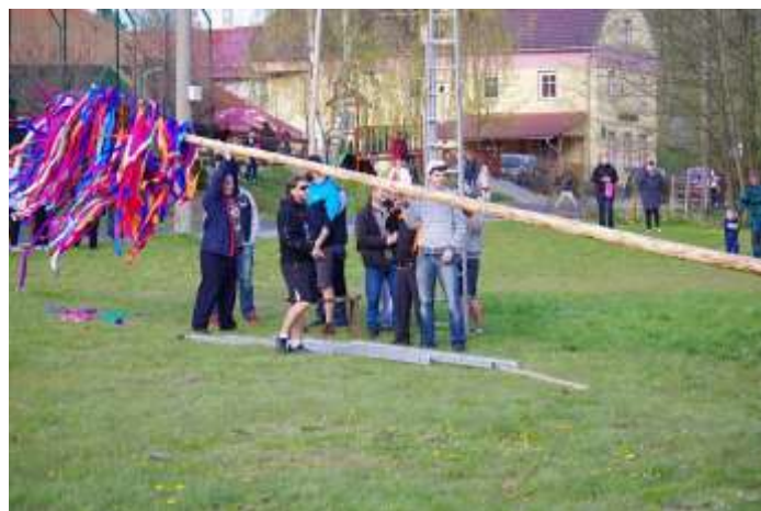
ZAČÁTEK TRADIČNÍHO RUČNÍHO STAVĚNÍ MÁJE