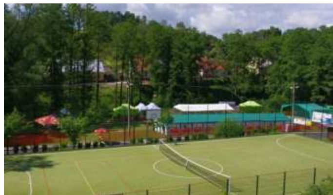
AREÁL RUDOLECKÉHO KOTLÍKU 2016 BEZ DIVÁKŮ

V hlavním programu vystoupilo sedm hudebních těles. Jako první se představila skupina DRC z Ostrova n. O., stálý účastník rudoleckého festivalu, svými vtipnými glosy a příjemnou muzikou nasadili latku ve stylu country s parádní atmosférou, která se pak táhla celým průběhem festivalu. Druhým vystupujícím byla kapela WOPEJKAČI z Chebu. Nováček na našem festivalu určitě nezklamal a svým country-rockovým pojetím přispěl k oživení atmosféry.