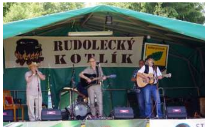
SKUPINA ZELENÁČI Z PRAHY