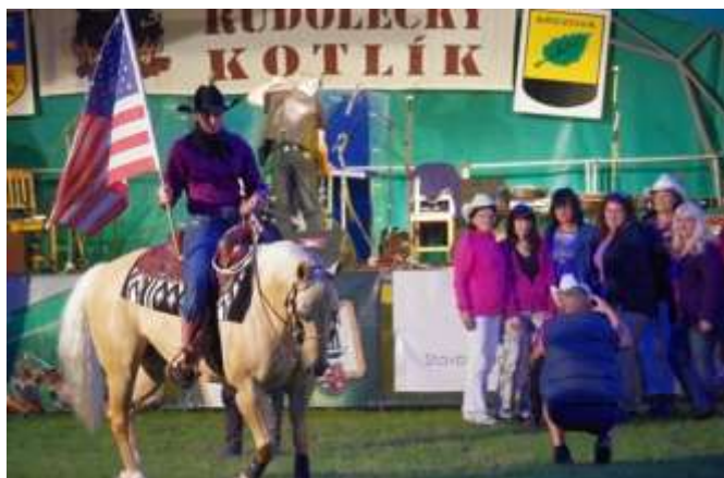
VEČERNÍ VYSTOUPENÍ S KONĚM