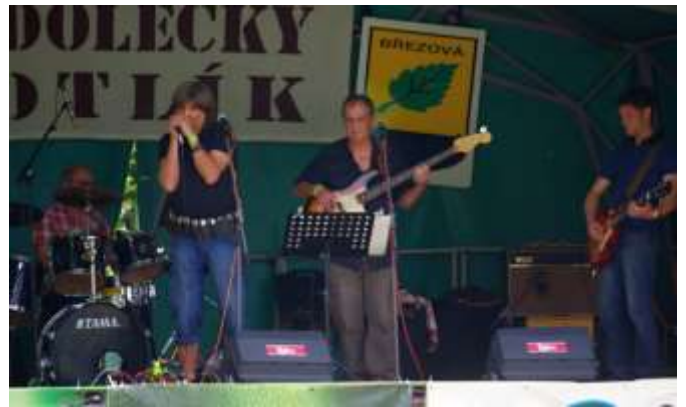
SKUPINA WOPEJKAČI Z CHEBU

Festival ale nežije jen vystoupením hudebníků. Doprovodný program byl zahájen v 13:00 hod. tradičními soutěžemi a hrami pro naše nejmenší. V rudoleckém parku bylo připraveno několik stanovišť, kde svoje dovednosti naši caparti předváděli. Celé toto odpoledne měla pod svými křídly pionýrská skupina z Březové. Další atraktivní soutěží byla střelba ze závodních luků pro malé i velké. Obrovský zájem dětí vzbuzovala hlavně možnost svézt se na hřbetu koně. Tuto atrakci zajišťovala jízdárna v Boučí a děti měli možnost se svézt na hřbetu malého či velkého koně. Novinkou dětského dne byla za přísných bezpečnostních opatření střelba z paintballových pistolí na terče či slaměného panáka zajišťována z řad rudoleckých občanů. Po celou dobu konání dětského dne měli děti možnost svézt se v krásném povozu s koňským spřežením, který jezdil okružní jízdu s prohlídkou rudoleckého statku. Velký zájem účastníků vzbudilo i „tetovací studio“ pana Ládi Panka. Vyvrcholením programu dětského dne byl příjezd dobrovolného hasičského sboru z Březové a nafoukání hasičské pěny do prostoru parku. Skotačící děti v pění a trošku nervózní rodiče završily vydařený dětský den. V doprovodném programu přímo v dějišti konání festivalu vystoupili mj. malé mažoretky ze základní školy na Březové, skupina Pšito oyate z Plzně se svým programem do kterého zařadily skupinové bubnování a tím přivolaly déšť, výuku country tanců,