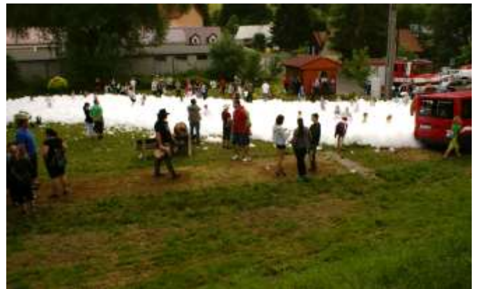
VYVRCHOLENÍ DĚTSKÉHO DNE – HASIČI Z BŘEZOVÉ