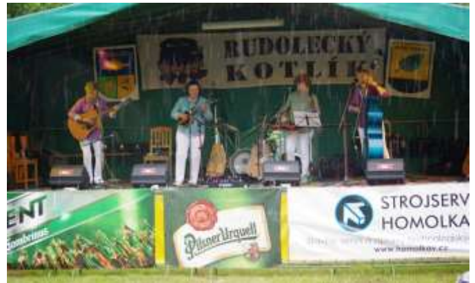
SKUPINA STAŘENKY Z PRAHY (BÝVALÉ SCHOVANKY)

Jen pro zajímavost, dosavadních šesti ročníků „Rudoleckého kotlíku“ se zúčastnilo 24 hudebních těles. Pět účastí má na kontě DRC z Ostrova, čtyři účasti si připsali ALISON z Kraslic, KV EXPRES z K. Varů a ULICE z Rotavy. Tři účasti mají TULÁCI z Ostrova a FÍCI z Habartova. Dvě účasti mají na svém kontě OD PLOTNY SKOK z Litoměřic, ROHÁČI z Lokte, MICHAL TUČNÝ revival z Plzně. Po jedné účasti mají PROSTATA z Březové, HOW-WADA ze Sokolova, hudební sešlost VRABCI Z ČECH , SPEKTRUM z Horního Slavkova, PLAVCI & JAN VANČURA z Prahy, BODLO z Vintířova, COP z Plzně, ZHASNI z Nového Boru, POUTNÍCI z Brna, hudební sešlost Karlovarska CRAZY HORSES , country z českého západu skupina BANKROT , STAŘENKY z Prahy, ZELENÁČI z Prahy, KAMELOT revival z Prahy a WOPEJKAČI z Chebu.