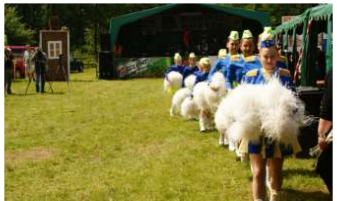
MALÉ MAŽORETKY ZE ZŠ BŘEZOVÁ