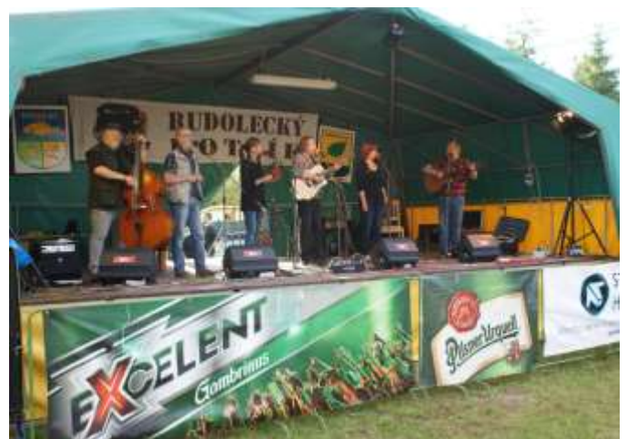
SKUPINA ROHÁČI Z LOKTE