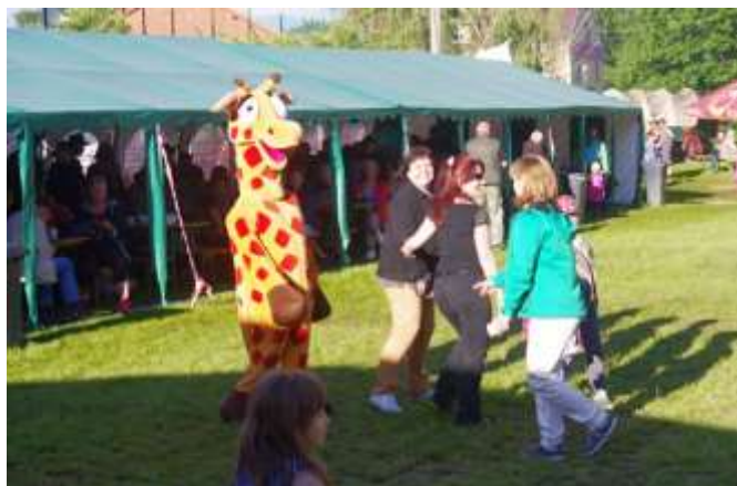
MASKOT KOTLÍKU MEZI DIVÁKY