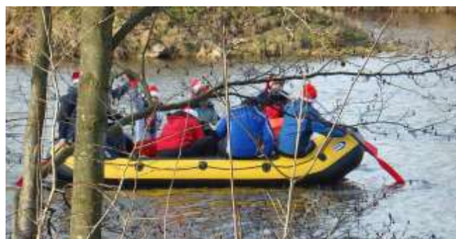
VODÁCI Z RUDOLCE SE SVÝMI KAMARÁDY NA SILVESTRA 2015