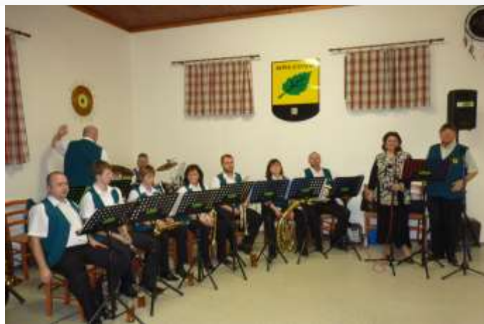
HUDEBNÍ USKUPENÍ BŘEZOVÁČEK PŘI OSLAVĚ MDŽ