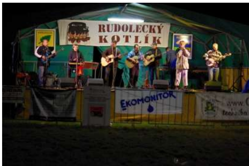
PŘIPOMÍNKA LOŇSKÉHO ROČNÍKU – SKUPINA BANKROT

NÁVRH PLAKÁTU LETOŠNÍHO ROČNÍKU, ZMĚNA VYHRAZENA