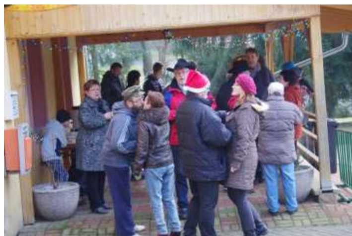
NĚKOLIK MOMENTEK ZE SETKÁNÍ

Lásku od milovaných, přátelství od přátel, větu od těch, kterých si vážíš, k tomu kapičku šťěstí a moře zdraví v roce 2016.