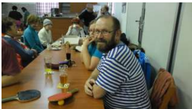
I DIVÁCI SE DOBŘE BAVILI