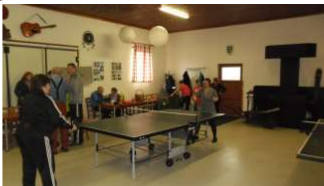
DĚVČATA V AKCI, VLEVO VÍTEŽKA TURNAJE

Podrobné výsledky turnaje s fotodokumentací naleznete na rudoleckých stránkách.