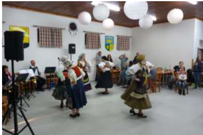
A JEŠTĚ JEDNOU Z VYSTOUPENÍ