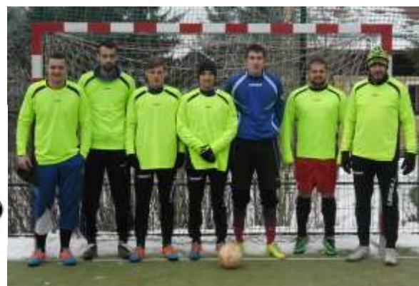
3. MÍSTO OBSADILI HRÁČI CAPTAIN TEAM

Další utkání v sobotu 9. dubna od 10:30 hod. HRB Král. Poříčí