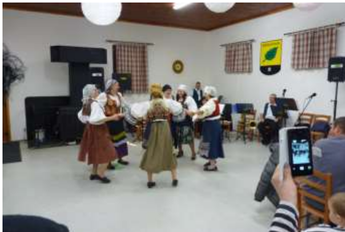
RUDOLECKÁ DĚVČATA PŘI SVÉM VYSTOUPENÍ