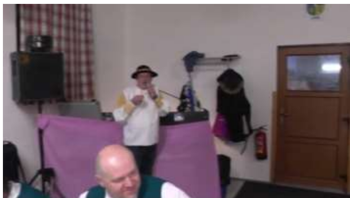
TONDA JANURA COBY KONFERENCIÉR