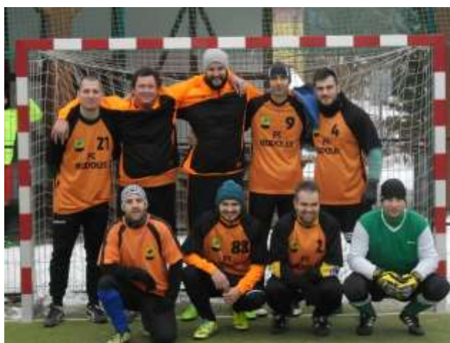
DOMÁCÍ BORCI FC RUDOLEC VYBOJOVALI 2. MÍSTO