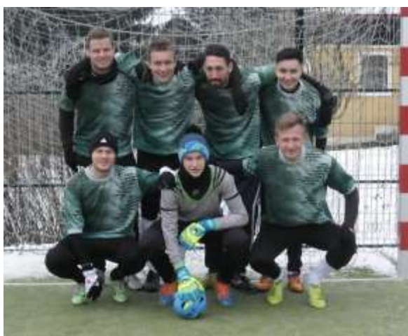
VÍTEŽOVÉ LETOŠNÍHO ROČNÍKU KRÁLOVÉ Z POŘÍČÍ

Za rok v sobotu 7. ledna při 12. ročníku tohoto turnaje na viděnou se těší pořadatelé z Rudolce!