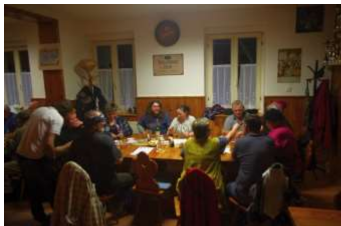
RUDOLECKÁ HOSPŮDKA S ÚČASTNÍKY AKCE