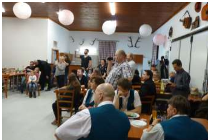
ÚČASTNÍCI OBDIVNĚ SLEDUJÍ VYSTOUPENÍ ŽEN A DĚVČAT