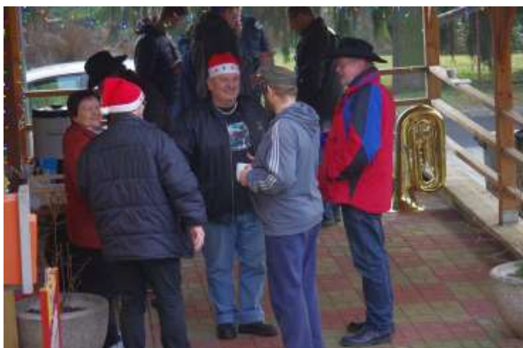
PAN STAROSTA V DRUŽNÉ DEBATĚ S RUDOLECKÝMI OBČANY