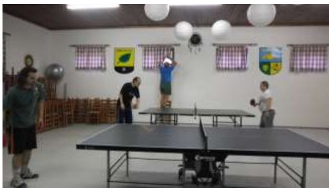
CHLAPCŮM PO NĚKOLIKA UTKÁNÍ ZAČÍNÁ BÝT TEPLO